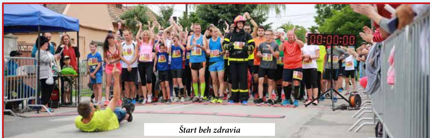
Štart beh zdravia