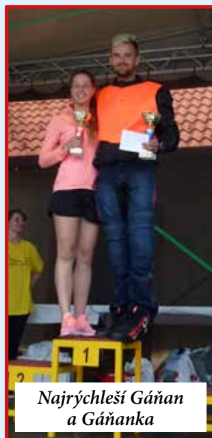
Najrýchlejší Gáňan a Gáňanka