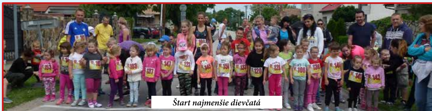
Štart najmense dievcata

Okrem traťových rekordov padol aj ten účastnícky – na