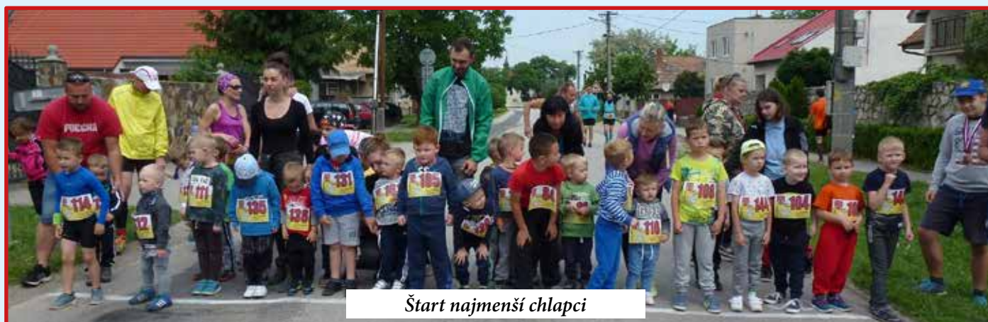
Štart najmenši chlapci