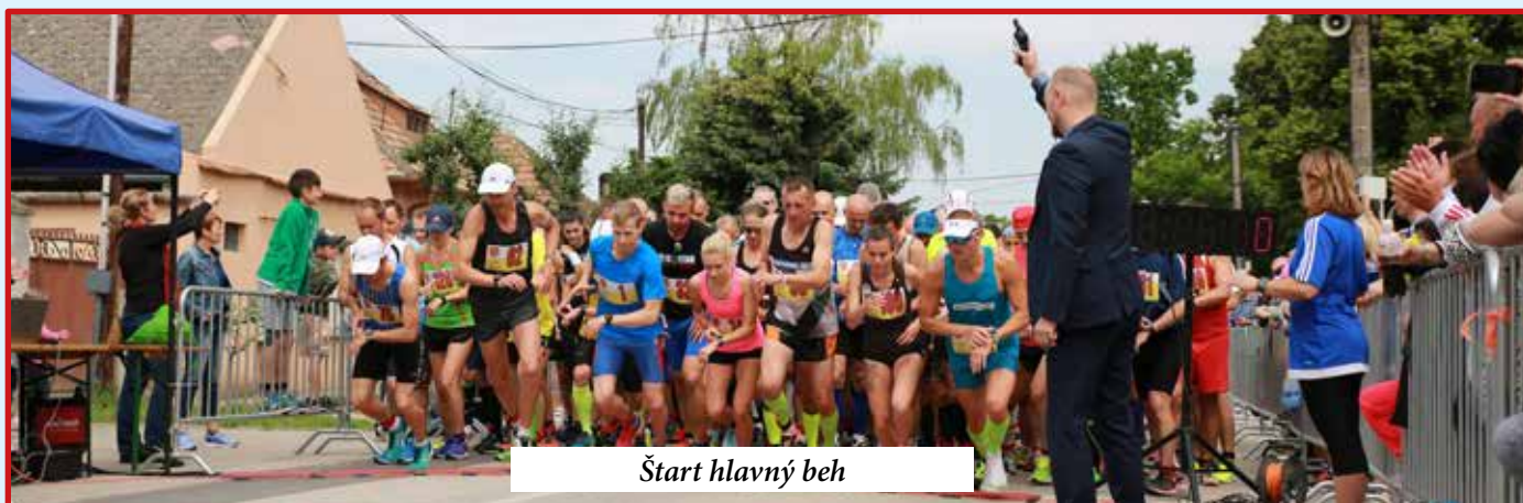
Štart hlavný beh