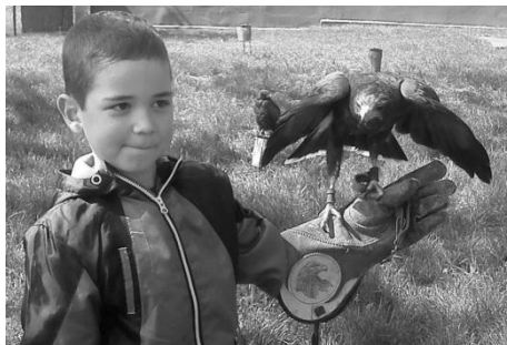
Sokoliar v MŠ

V jeden aprílový piatok navštívil našu materskú školu sokoliar. Priniesol so sebou veľké množstvo dravých vtákov a oboznámil deti s ich spôsobom života. Detičky boli zvedavé na ich let, mohli niektoré vtáky nakŕmiť a podržať na svojej ruke. zvedavé na ich let, mohli niektoré vtáky nakŕmiť a podržať na svojej ruke.